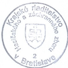
riaditeľ Krajského riaditeľstva Hasičského a záchranného zboru v Bratislave

Osvedčenie platí bez časového obmedzenia.